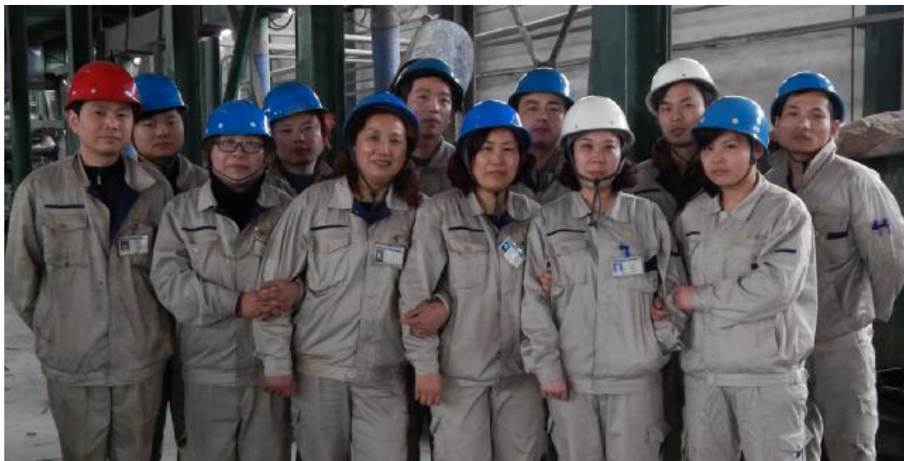
大年三十坚守岗位的镀锌丙作业区全体员工