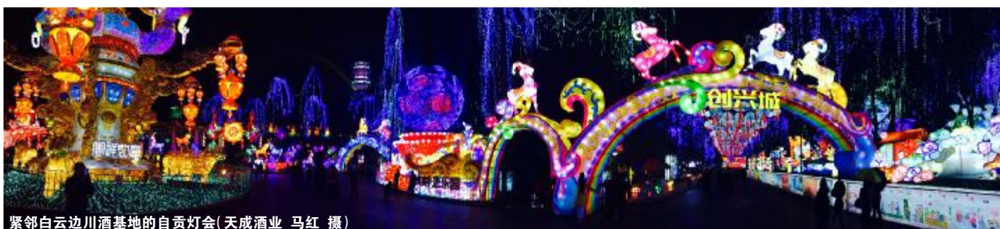
紧邻白云边川酒基地的自贡灯会

前进没有终点站，再接再厉一五年，酒店全员新目标——定实现！ (白云边大酒店 周俊)